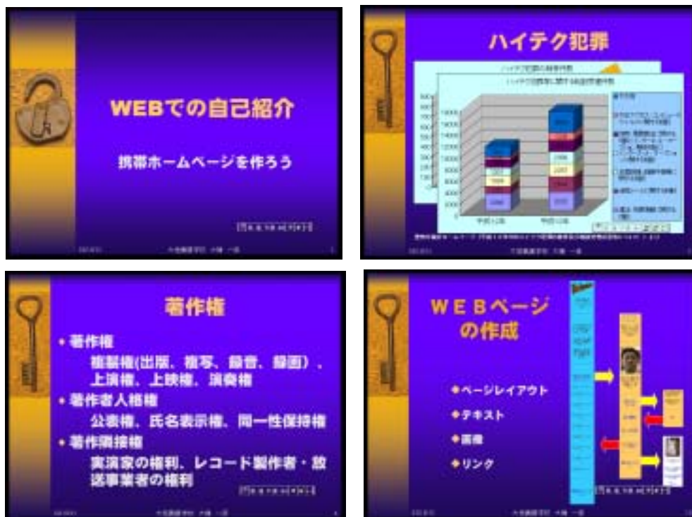
図1 プレゼンテーション画面の一部